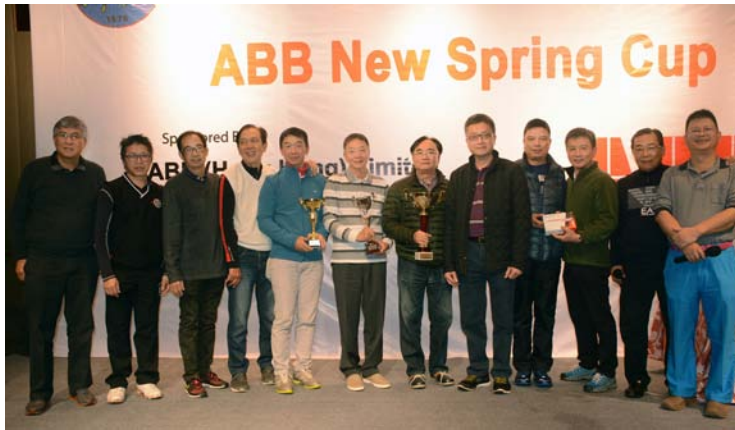
ABB CNY Cup Golf Competition was successfully held on 24 February 2017 (Fri) at Mission Hill Golf Club - Els Course. We would like to express our appreciation to ABB (Hong Kong) Limited for the kind sponsorship and the keen participation of team members and guests.