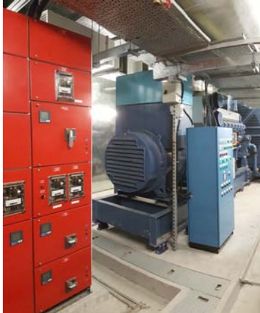
Diesel Generator Set

The whole development is powered by 11 x 1500kVA transformers. Total capacity of emergency generators is 7350kVA. It consists of one 1350kVA FSI diesel generator set and three 2000kVA Non-FSI diesel generator sets equipped with a 7,500 litre underground fuel tank. Medical equipment and server room are further backed up by UPS of total capacity of 1350kVA.